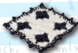
▲スクエアコースター